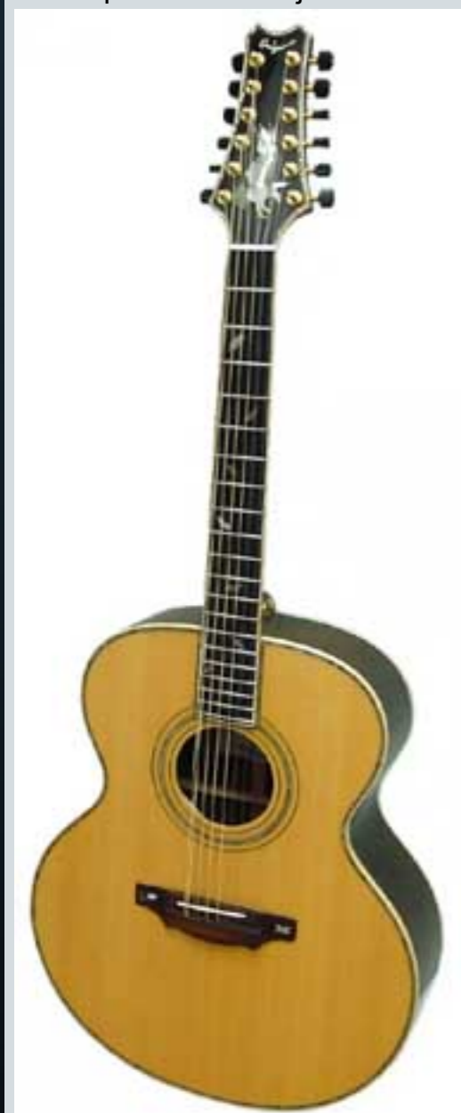
Modèle superjumbo Quéguiner

Jusqu'à maintenant, vous l'avez toujours utilisée comme une six cordes en vous disant que le son est magnifique, mais que c'est tout de même plus difficile à jouer : et si vous l'essayiez...comme une douze cordes ?